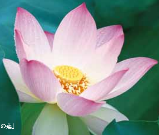
今月の一枚「七月の蓮」